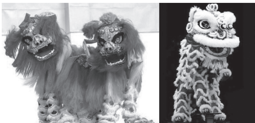
ภาพที่ 2 การเชิดสิงโตเหนือ (ภาพซ้าย) และการเชิดสิงโตใต้ (ภาพขวา)